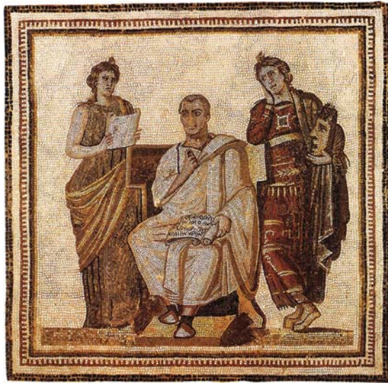
Romersk mosaik från 200-talet e.Kr. föreställande Vergilius

I latin studerar man latinskt språk och litteratur från alla tidsepoker. Bland texterna från den antika perioden har vi både inskrifter och de stora litterära texterna från klassisk (ca 100 f.Kr. till 14 e.Kr.) och senare tid (till ca 600). Från medeltiden fram till ca 1800 finns mycket material skrivet på latin inom kyrkan och diplomatin, men också inom skönlitteraturen och vetenskapen. I grundutbildningen läser vi i första hand antika författare som Caesar, Cicero, Vergilius, Horatius och Ovidius, men ger även en översikt över språket och litteraturen från de senare perioderna.