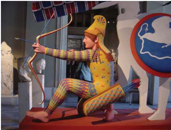
Bågskytt från Afaiatemplet på Egina

Antikens kultur och samhällsliv är tvärvetenskapligt och behandlar det antika Grekland och Rom från äldsta tid fram till ca 500 e.Kr. Vi läser om både förhistoriska och historiska samhällen ur arkeologiska, historiska och konstvetenskapliga perspektiv och vi kommer i kontakt med vitt skilda