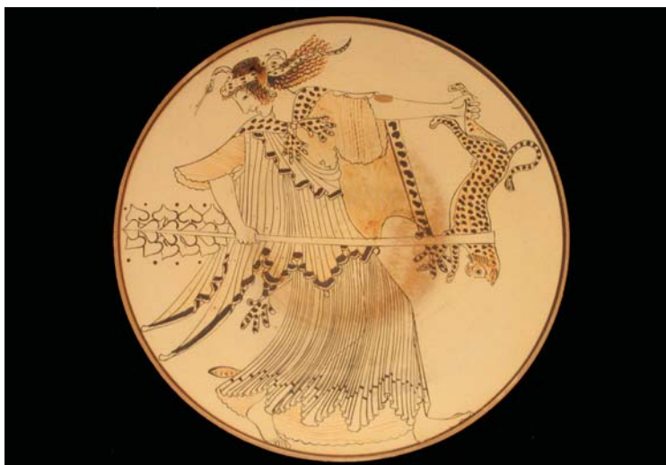
Menad av Brygos-målaren, ca 490 f.Kr.

Då är kandidatprogrammet KLASSISKA STUDIER något för dig! Genom att studera både språk, historia och kultur i det antika Grekland och Rom får du en bred och sammanhängande bild av två civilisationer som påverkat och påverkar Europa och världen på gott och ont.