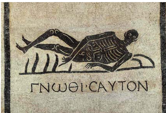
Mosaik från Via Appia med skelett och den grekiska texten "gnothi seauton – känn dig själv"

Inom ämnet grekiska studerar du det grekiska språket och litteraturen från äldsta tid (ca 700 f.Kr.) till Konstantinopels fall 1453, med viss tyngdpunkt på den antika perioden. Som student får du kunskaper om och läser ur verk av författare som Homeros, Herodotos, Thukydidides, det klassiska Atens tragediförfattare och talare och filosofen Platon, men även om viktiga och intressanta gestalter från hellenistisk tid och kejsartid, samt från den bysantinska perioden.